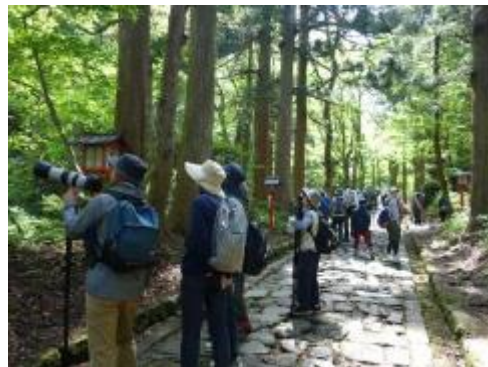
昨年の探鳥会風景(大山寺)