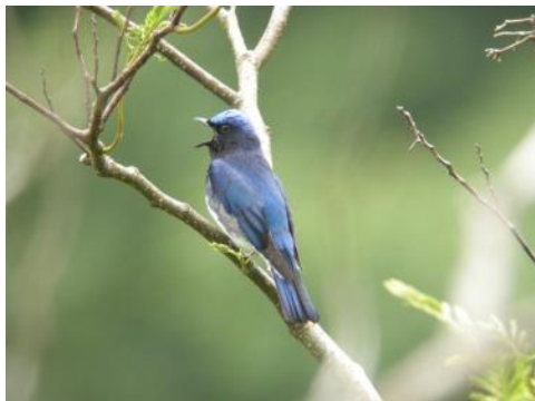
オオルリ(鳥取市の鳥)